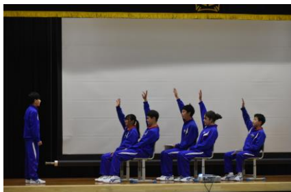
授業中『良い姿』の実演

その中でのメインは、1年生の発表です。昨年度の同時期、見る側、聞く側で参加していた立場から、発表する立場となり月日の経つ早さとともに、成長の大きさを実感しました。