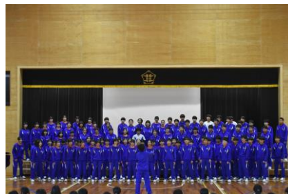
学年合唱『明日へ』披露