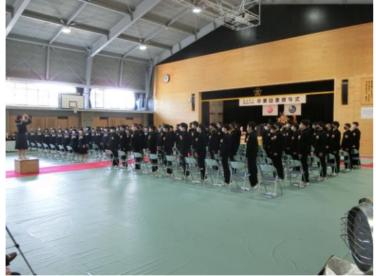
【卒業証書授与式 学年合唱】