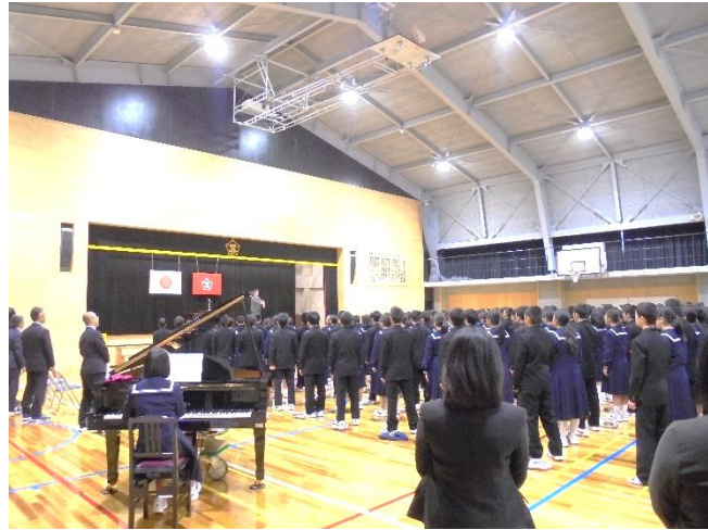
久しぶりに歌った校歌でしたが、堂々と歌いきりました。

式後には、2学期に収められた各種大会やコンクールの成績が披露され、受賞した生徒が表彰されました。1学期の時とは違って力強い返事が響き、北中生の成長が表れていました。