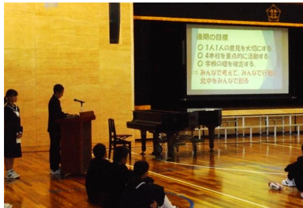
後期の目標を下ろす中根会長。

この目標を受けて、それぞれの委員会で活動の方針を立てました。環境委員会では、「日本一きれいな瑞