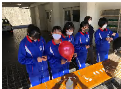
<11/14 日吉町風船とぼし>