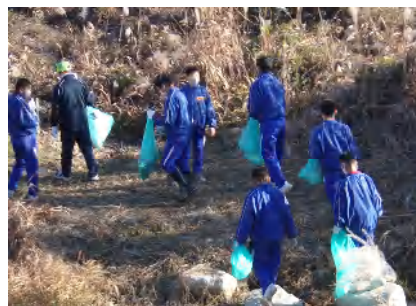
<12/5 土岐川清掃ボランティア>