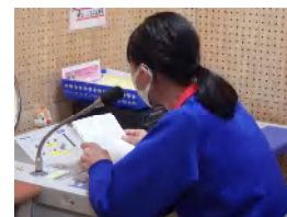
アルミ缶回収についての思いを語る3年級長

後期の生徒総会が、全校放送を通じて行われました。後期の執行部および各委員会の委員長による活動方針の説明が主な内容でした。